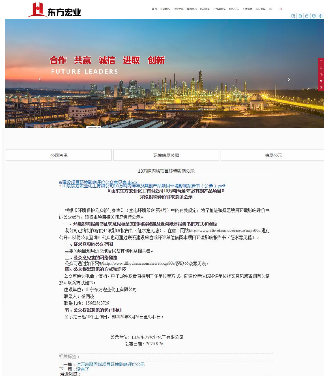
图 2.2-1 网上第二次公示截图

2020 年 8 月 26 日至 9 月 7 日，在公司网站（ http://www.dfhychem.com/ ）上对建设项目进行了征求意见公示，并附上环境影响报告书征求意见稿及公众意见表作为附件。公示截屏见图 3.2-1。