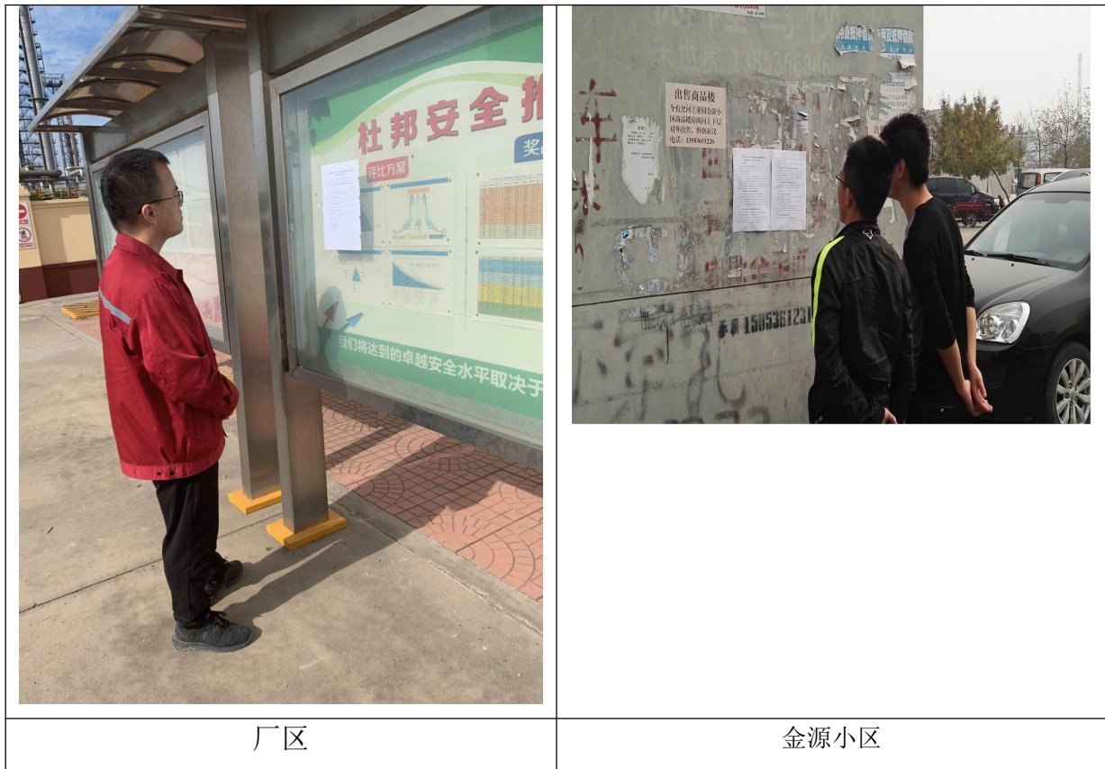
图 3.2-3 张贴公示截图