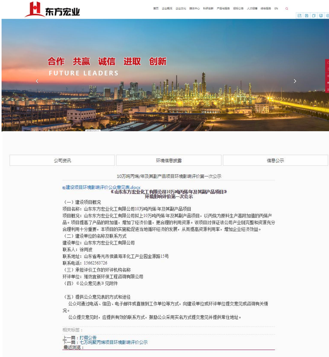
图 2.2-1 网上第一次公示截图

( http://www.dfhychem.com/news/404.html ) 对建设项目进行了第一次公示，并附上公众意见表作为附件。公示截屏见图 2.2-1。