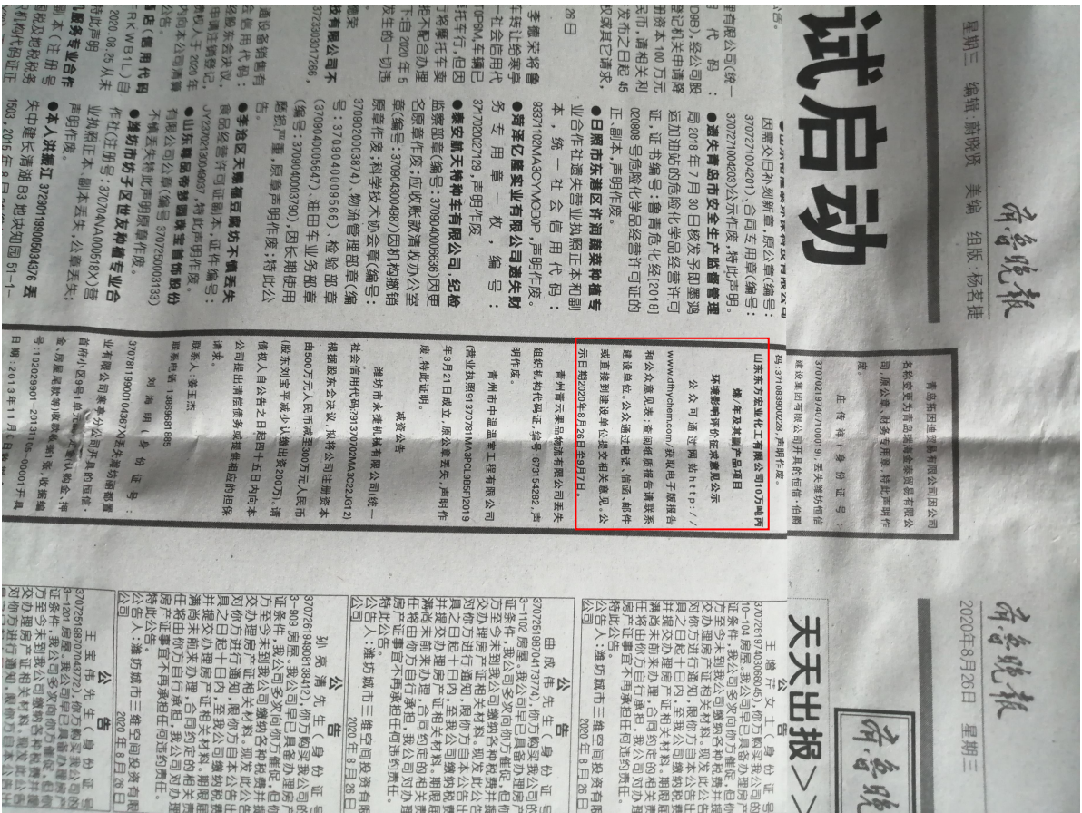
图 3.2-2 报纸第二次公示截图